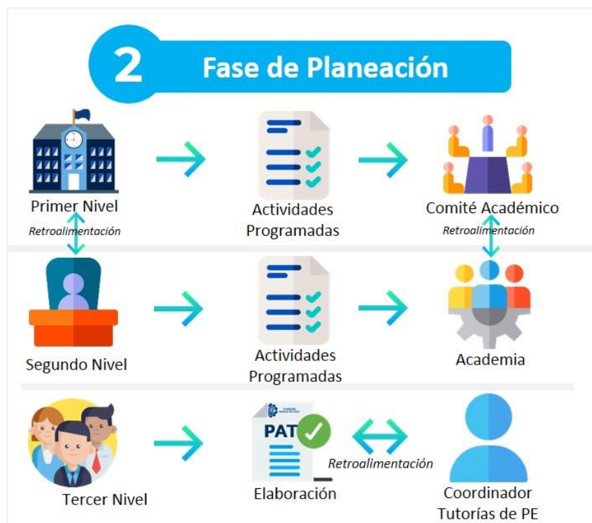
Figura 3. Fase de Planeación del Proceso de Tutoría. Elaboración propia.

Se busca que la planeación sea coherente con la misión y apoye al logro de los objetivos y metas institucionales.