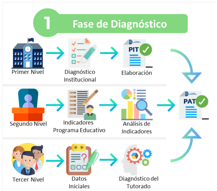
Figura 2. Fase de Diagnóstico del Proceso de Tutoría. Elaboración propia.

Con el diagnóstico, se realiza posteriormente la planeación de las actividades del Programa Institucional de Tutorías (PIT) y Plan de Acción Tutorial (PAT), en el que se definen las metas y las estrategias de trabajo para el periodo administrativo y escolar correspondiente.