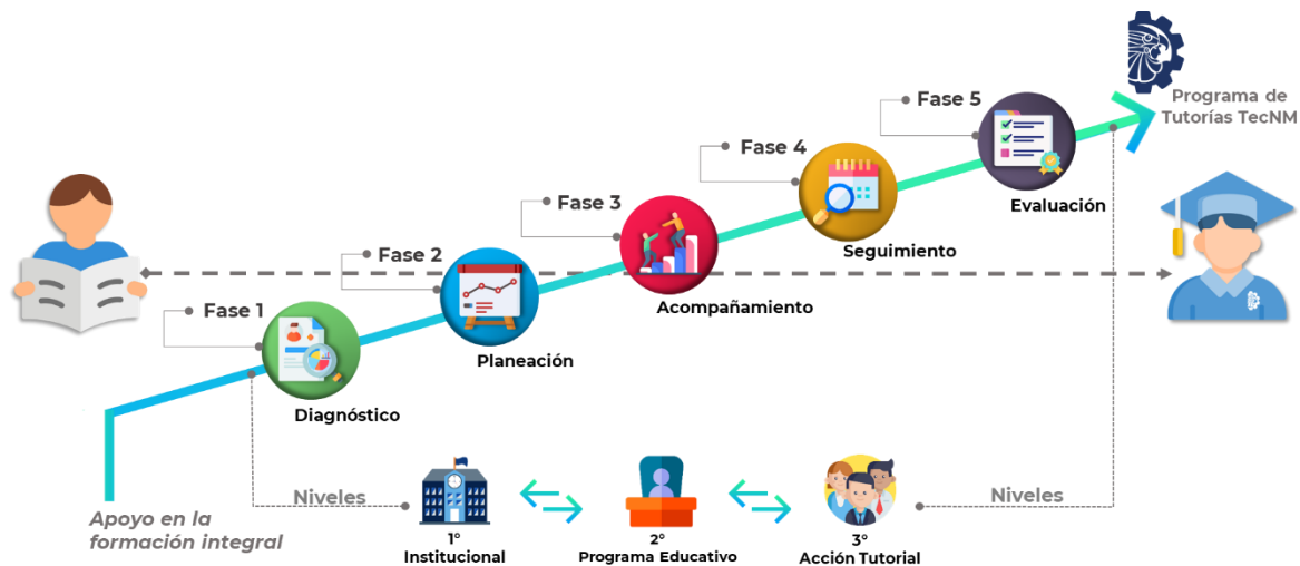
Figura 1. Operación del Programa de Tutorías. Elaboración propia.

En cada una de las fases, se establecen tres niveles de atención: el primero a nivel Institucional encabezado por las autoridades administrativas (Titulares de Direcciones y Subdirecciones Académicas, o sus equivalentes en los Tecnológicos Descentralizados) y delegado en las Jefaturas de Desarrollo Académico con la Coordinación Institucional de Tutorías. El segundo nivel se encuentra al interior de los Programas Educativos , cuya responsabilidad se encuentra en la Jefatura de Departamento Académico y delegado en la Coordinación de Tutorías del programa educativo, y el tercero , recae en la persona Tutora el acompañamiento directo al estudiante en la Acción Tutorial (Álvarez González & Álvarez Justel, 2015).