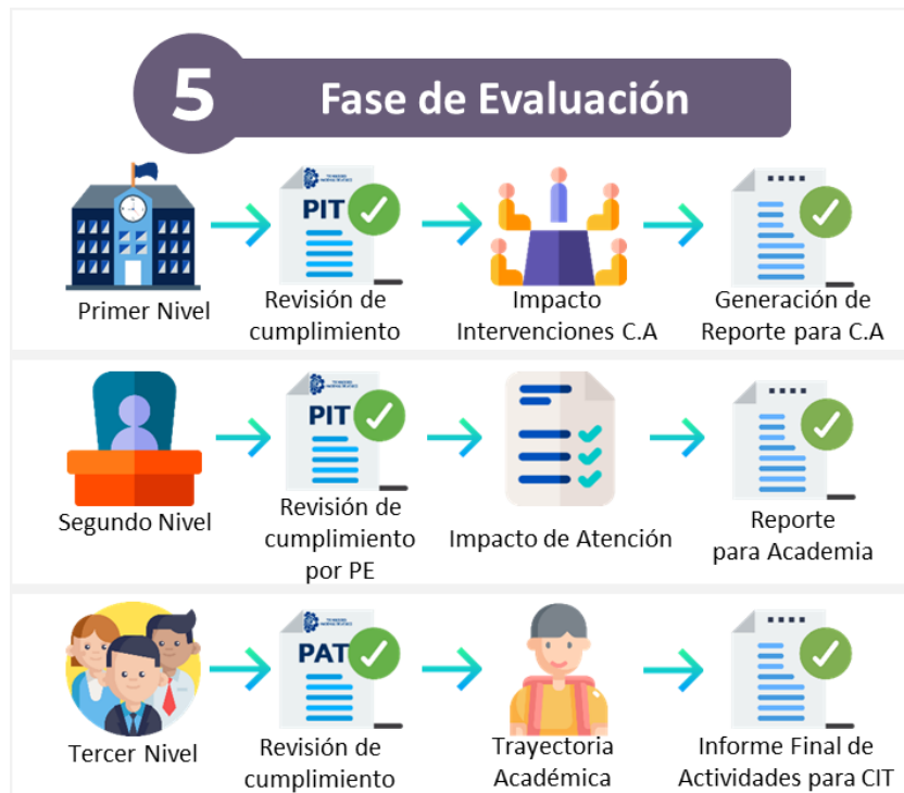
Figura 6. Fase de Evaluación del Proceso de Tutorías. Elaboración Propia.