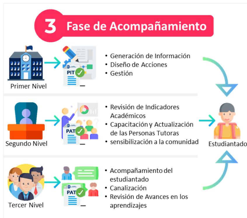
Figura 4. Fase de Acompañamiento del Proceso de Tutorías. Elaboración Propia.

Para las modalidades semipresenciales y virtual, se adicionan como directrices la inducción a la modalidad y herramientas tecnológicas en el primer ingreso, orientación sobre el manejo de las TIC's, monitoreo de presencia y actividad del estudiantado en plataformas, incentivo a la motivación y elaboración del plan de trabajo.