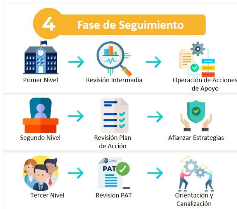
Figura 5. Fase de Seguimiento del Proceso de Tutorías. Elaboración Propia.

Para las modalidades semipresencial y virtual se adiciona la revisión del avance en el plan de trabajo y del avance de las actividades trabajadas en la plataforma.