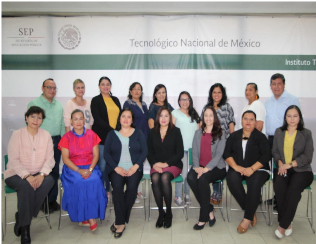
Figura 1. Grupo de trabajo de la revisión y actualización PNT TecNM

Como parte de una estrategia académica, en febrero y mayo del 2018, la Dirección de Docencia e Innovación Educativa a través del Área de Desarrollo Académico, reúne a un grupo de representantes de 13 Institutos tecnológicos adscritos al TecNM para contribuir al Programa Institucional de innovación y desarrollo 2013-2018 en la revisión y actualización del Plan de Tutorías Vigente del TecNM.