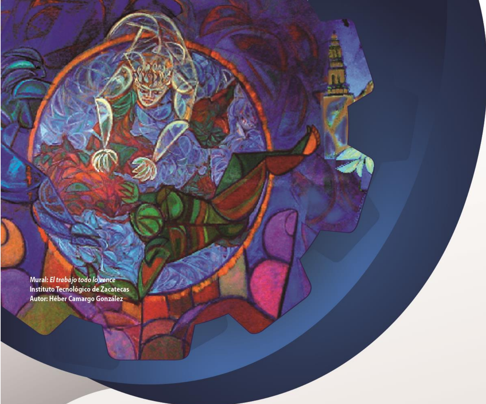
Mural: El trabajo todo lo vence Instituto Tecnológico de Zacatecas Autor: Héber Camargo González